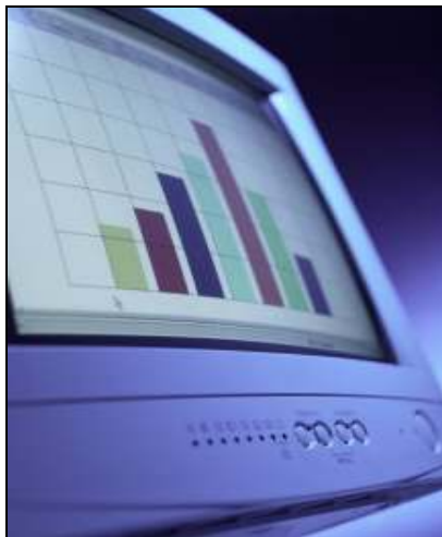
Computer en internet: niet meer weg te denken