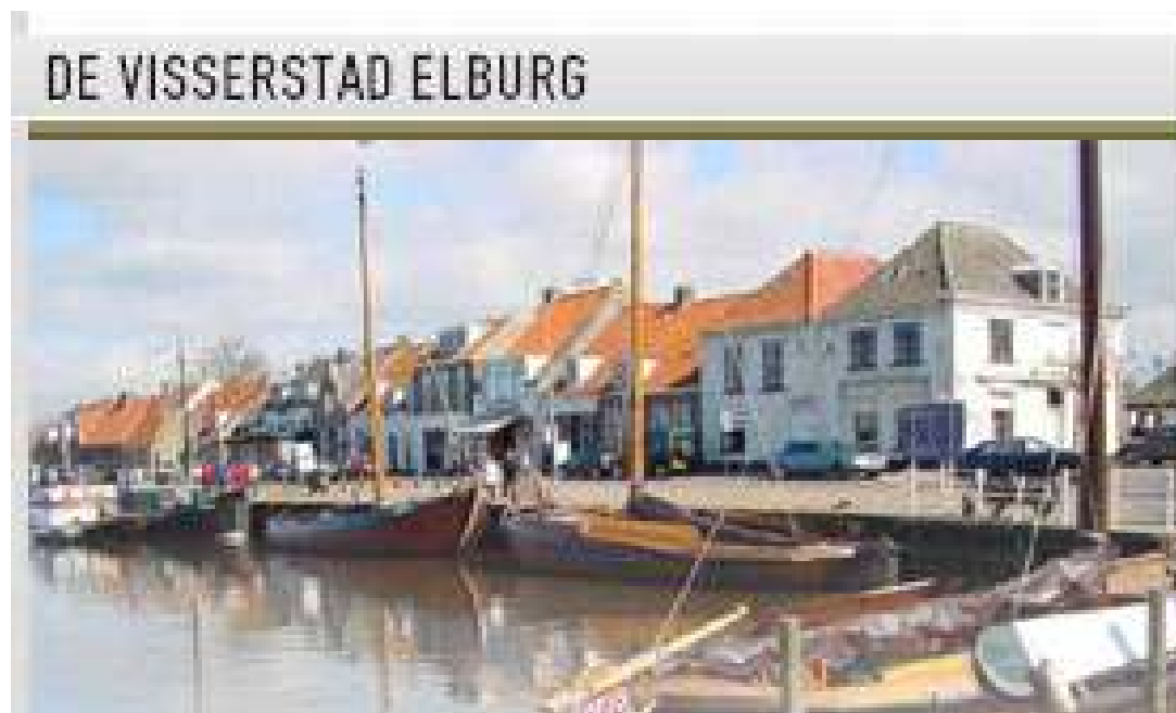
DE VISSERSTAD ELBURG

Door het realiseren van goede voorzieningen.